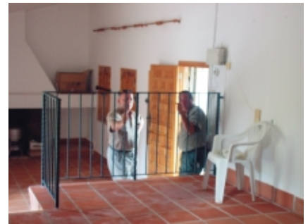
Pequeños cambios en el interior de las instalaciones

Murcia, donde se ponen de manifiesto los valores culturales y naturales que se encuentran en el Majal Blanco. No obstante el visitante puede elegir sus propios recorridos utilizando la red de caminos y sendas que hay en su interior; o bien puede apuntarse a las visitas guiadas que la Concejalía de Urbanismo y Medio Ambiente viene realizando desde el año 2002 los domingos establecidos.