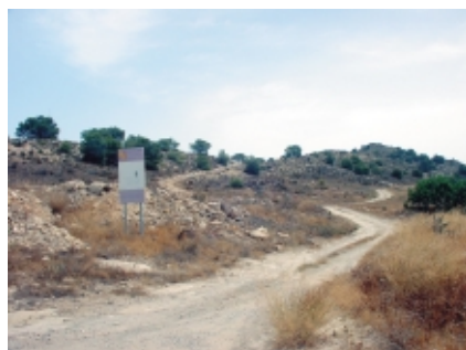
Vereda de los Villares