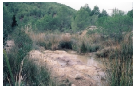
Cordel de Fuente Álamo