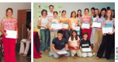
A la izquierda se encuentran los ganadores del Primer Premio, y a la derecha todos los premiados del concurso

4º Accesit: cuyo premio consta de 2 juegos de pintura, 1 juego de vídeos de Félix Rodríguez de la Fuente y descenso de Almadenes.