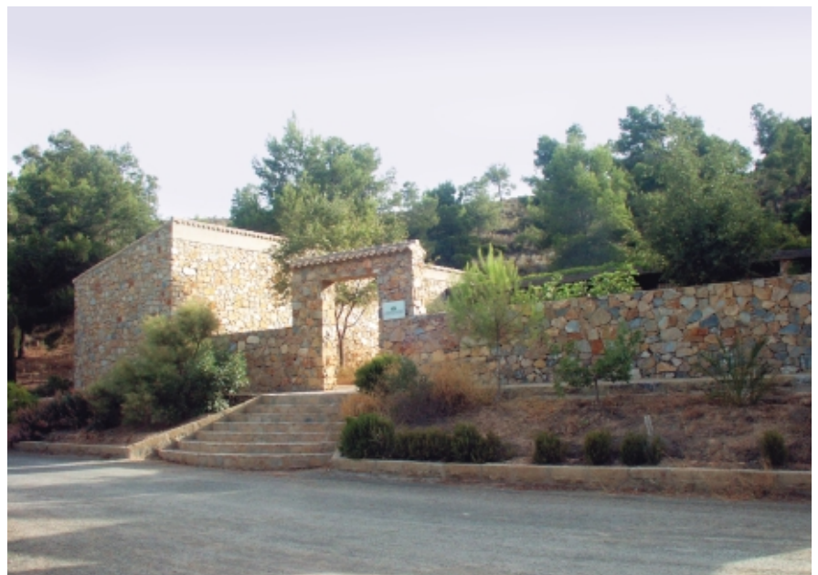
Acceso principal Aula de Naturaleza

Entre los proyectos propuestos destaca la localización de un Punto de Información para los visitantes en el principal acceso a la finca, el aparcamiento de Las Morenas; y cabe la posibilidad también que en un futuro se habilite una de las estancias del Aula como Centro de Visitantes.